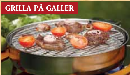
GRILLA MED MUURIKKA