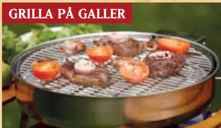
GRILLA PÅ GALLER